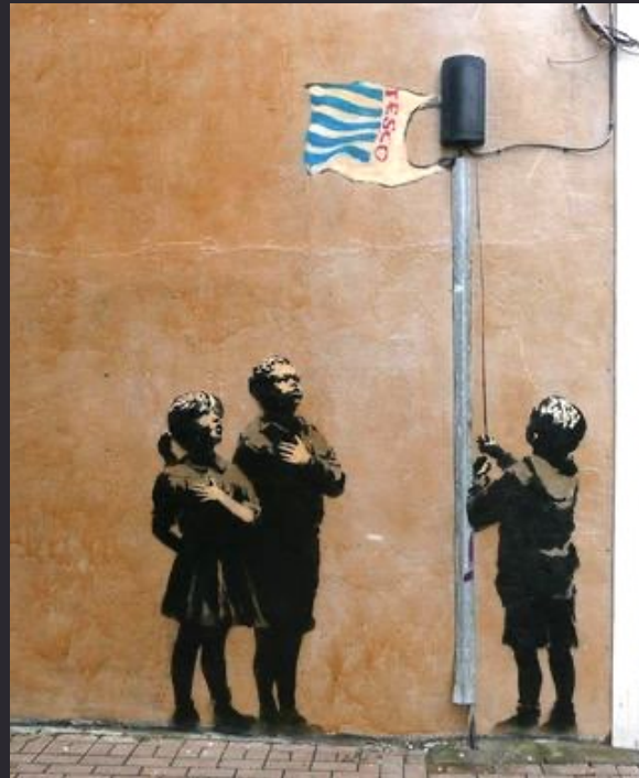
Banksy , Every little Helps , Londres, 2008