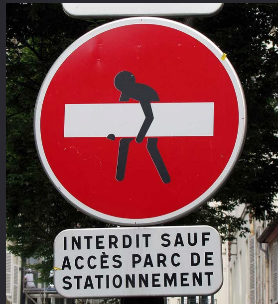
Clet Abraham , interdiction de passer , Paris, 2014