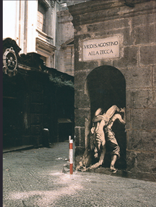
Ernest Pignon Ernest , Epidémies , dessin sérigraphié, Naples, 1990

A partir d'un détail suggestif de l'espace présent chez vous, vous intégrerez un élément précis, une figure / un objet dessiné modelé , pour révéler une nouvelle réalité de cet espace. Vous photographierez votre installation.