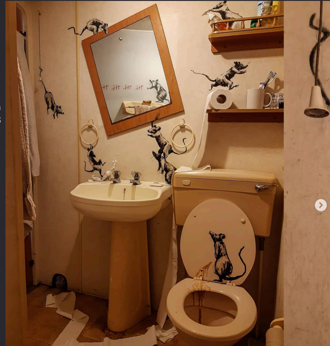
Banksy , œuvre réalisée dans sa salle de bains pendant le confinement, 2020

Comment la mise en scène d'un élément dessiné peut-elle modifier notre perception d'un espace réel ?