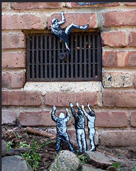
Joe Iurato , silhouette de bois miniatures , 2019