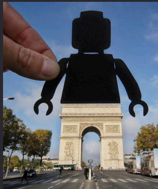
Rich Mc Cor , Série Paperboyo , 2015