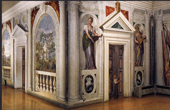
Veronèse , Villa Barbaro , fresques en trompe-l'œil, Trévise, 1560-1561