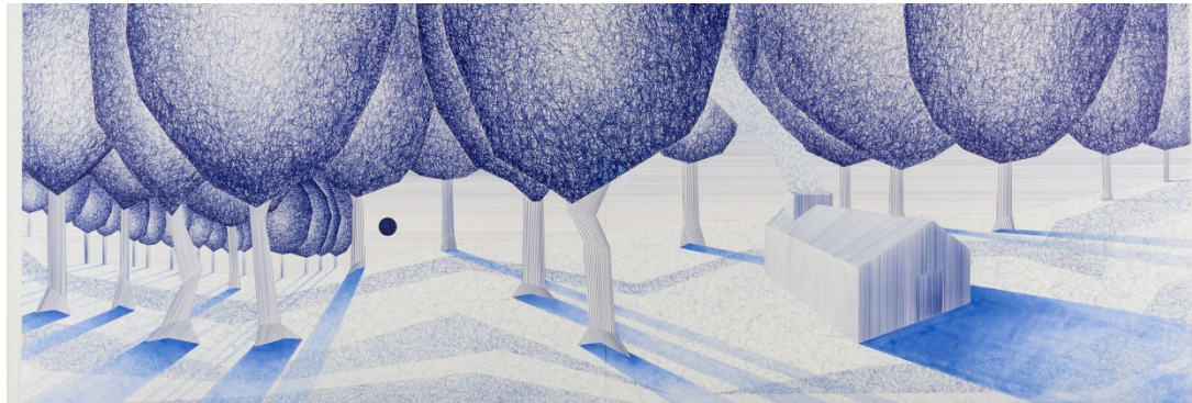
Charles Laib Mitton , Mal comportement dans la Prairie , stylo à bille sur papier, 2012