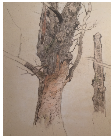
Nozal Alexandre , Etude de tronc , fusain,