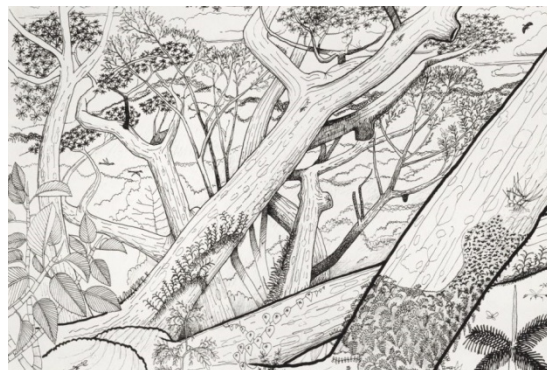
Dessins préparatoires par le botaniste Francis Hallé au film pour Il était une fois , film réalisé par Luc Jacquet