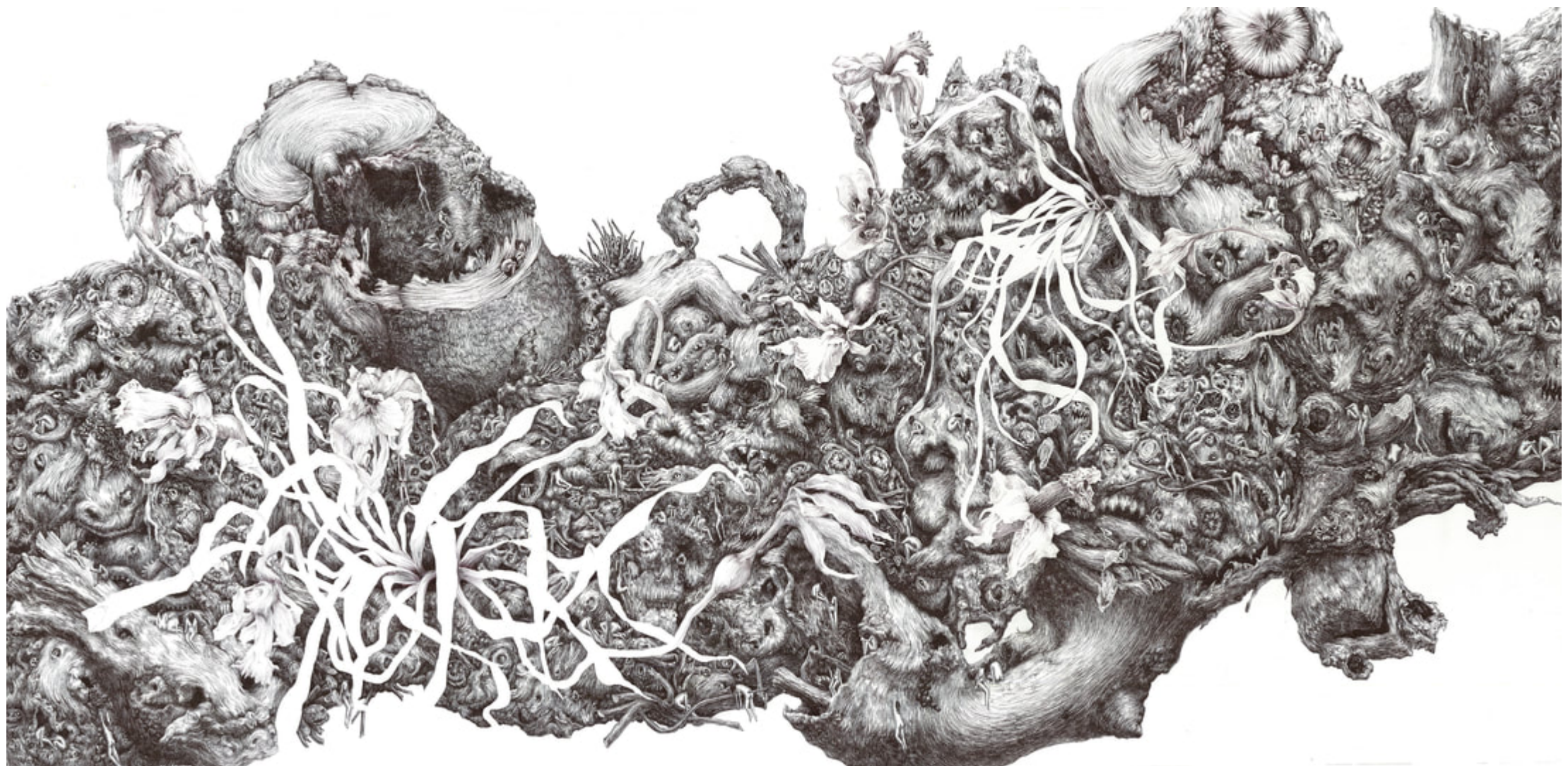
Jisoo Yoo , Métamorphose , 2017, stylo bille sur papier-107x52l cm

L'illusion d'une invasion progressive peut-elle être créée par une image fixe ?