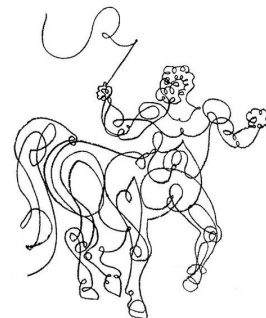
Pablo Picasso , Centaure , craie grasse 1920