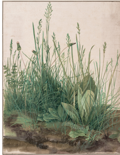
Alexandre Dürer , Touffes d'herbes , 1503, plumes aquarelle et gouache, 41 × 31,5 cm