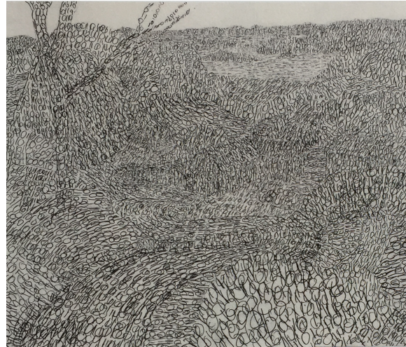
Tony Cragg , Sans titre , 2007, mine graphite sur papier, 36,5 x 42,7cm. Musée Pompidou