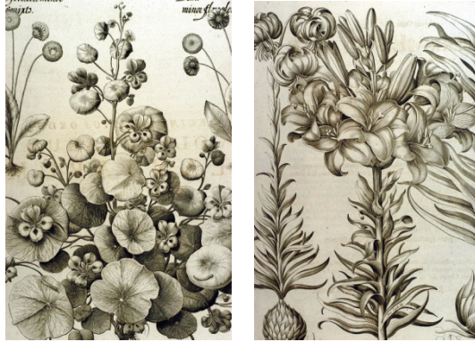
Hortus Eystettensis , planches botaniques du Jardin d'Eichstätt, 1613